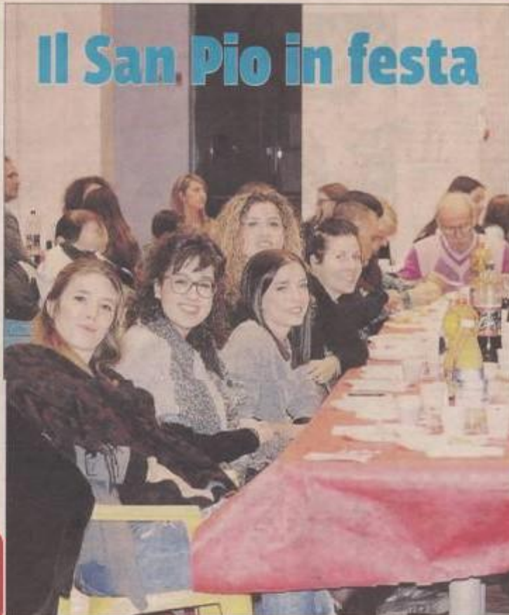
In trionfo alla festa della Polisportiva San Pio 2: un vero successo per la grande famiglia