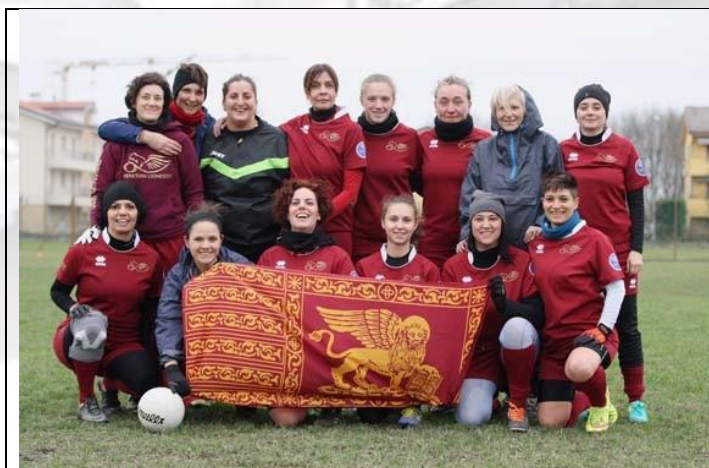
Venetian Lionesses