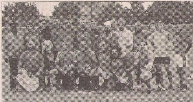
ROUNDERS | partecipanti alla storica sfida disputata a Rovigo l'otto ottobre

Aprile è stato il mese delle Leonesse Venete, terze nella tappa a Rubano del torneo regionale di calcio gaelico Centro-Est Europa della Gaelic Athletic Association, e soprattutto è stato il mese della prima Alpen Cup di pallamano, vinta dall'Ascaro Ro-