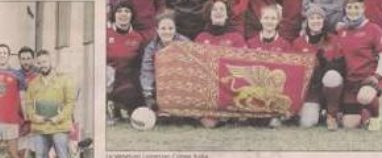
Le nazionali italiane Coppa Italia