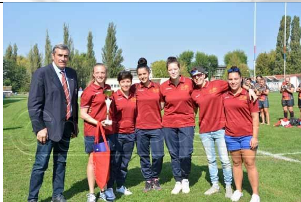
Le Ascare Rugby Ladies Rovigo

Il mese di Marzo riprende da dove si era interrotto il precedente. A Villadose, sempre con l'organizzazione affidata alla New Ascaro Rovigo asd, si recupera infatti la tappa di Coppa Italia sospesa per pioggia il 14 Febbraio. Questa volta le atlete vengono accolte da un fastidiosissimo vento freddo, ma almeno si può