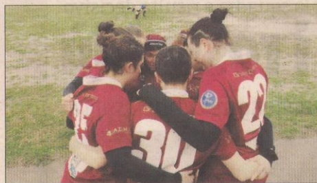
Il rugby femminile cresce grazie ad Ascaro, Villadose, Monselice ed Este

Villadose matureranno esperienza nella categoria, vista l'opportunità di poter giocare la Coppa Italia nelle fila dell'Este. "Questo continuo interscambio porterà ad avere numeri importanti, numeri utili per promuovere e sviluppare il progetto a 360 gradi, grazie alla realizzazione di un nutrito vivaio necessario per gettare le basi di una squadra Seniores sempre più competitiva. - spiega il Comitato - l'obiettivo dichiarato dai quattro presidenti che sigleranno l'accordo di franchigia è quello di collaborare per la crescita