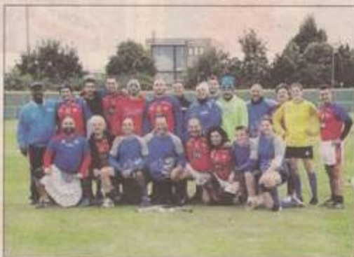
I partecipanti all'evento sportivo svolto in via Vittorio Veneto

ROVIGO - Sabato il New Field di via Vittorio Veneto a Rovigo è stato teatro di una particolare sfida. Un match dal sapore antico, organizzato dal Bsc Rovigo e dalla New Ascaro Rovigo per celebrare i primi cinque anni del sodalizio polesano, che per primo ha imposto le discipline sportive irlandesi in Italia. Tra queste c'è il rounders, il gioco che nelle colonie d'oltreoceano, agli inizi dell'800, ha dato origine al moderno baseball. La versione "Mixed" del rounders giocata al New Field di Rovigo, è stata una bella sfida, equilibrata e giocata nei sette inning. Da registrare la fuga iniziale dei "gaelici" dell'Ascaro. Alla fine il risultato ha premiato le