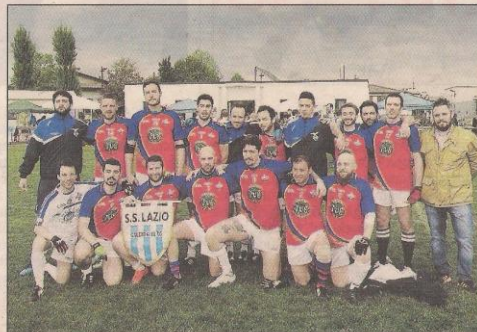
Nelle foto di Giampaolo Defanti alcuni momenti del torneo che si è svolto a Rubano e che ha coinvolto circa 200 atleti provenienti da tutta Europa