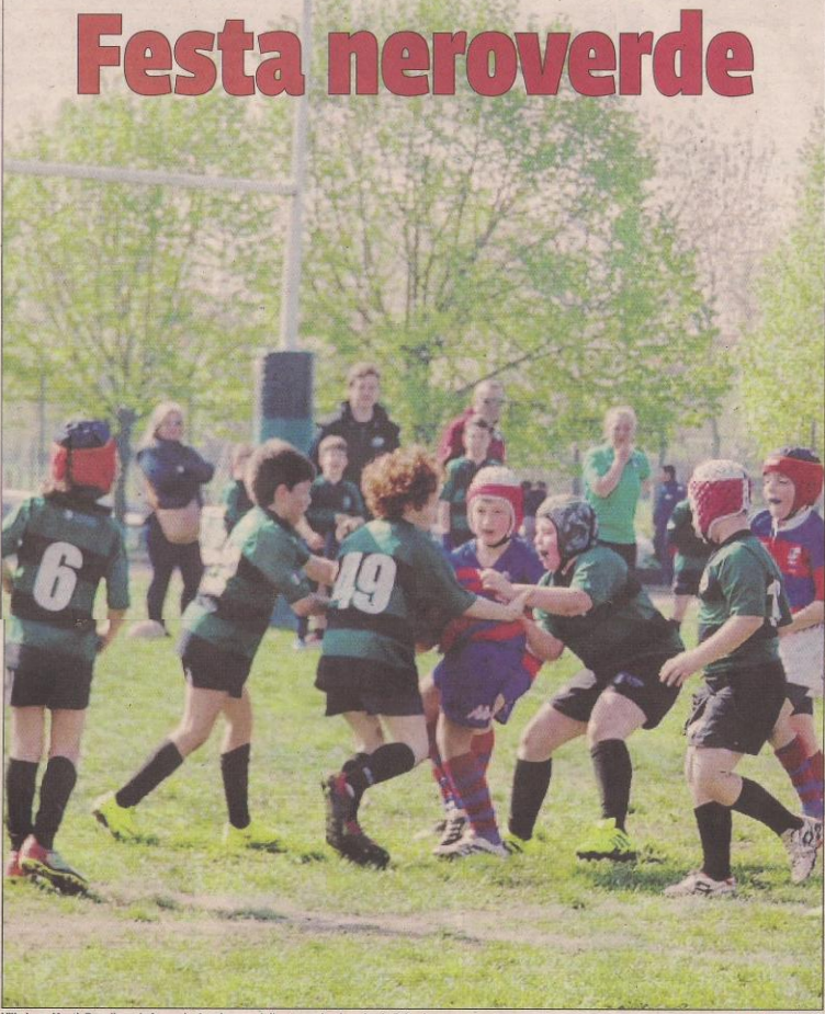
Villadose, Monti, Rosolina e le formazioni padovane si divertono al raduno in via Pelandra A pagina VI