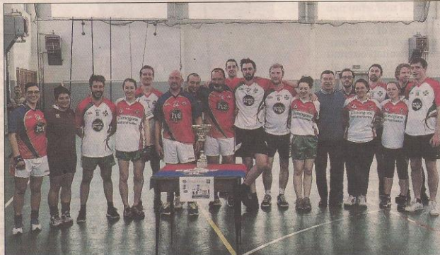
Un incontro emozionante anche in palestra a Mardimago