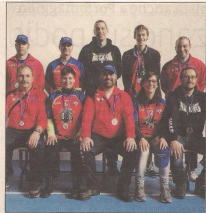
Handball che passione con la Polisportiva New Ascaro Rovigo