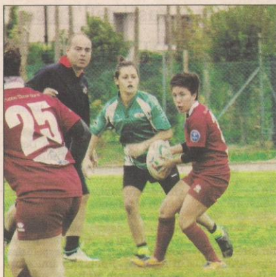
Un ricco weekend anche per il movimento femminile