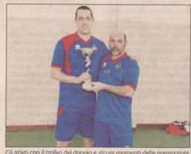
Gli atleti con il trofeo del doppio e alcuni momenti delle premiazioni