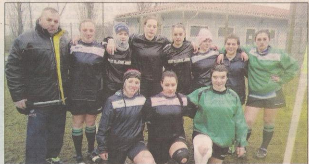
Nelle foto, le ragazze del Rugby Villadose nella tappa di Badia Polesine