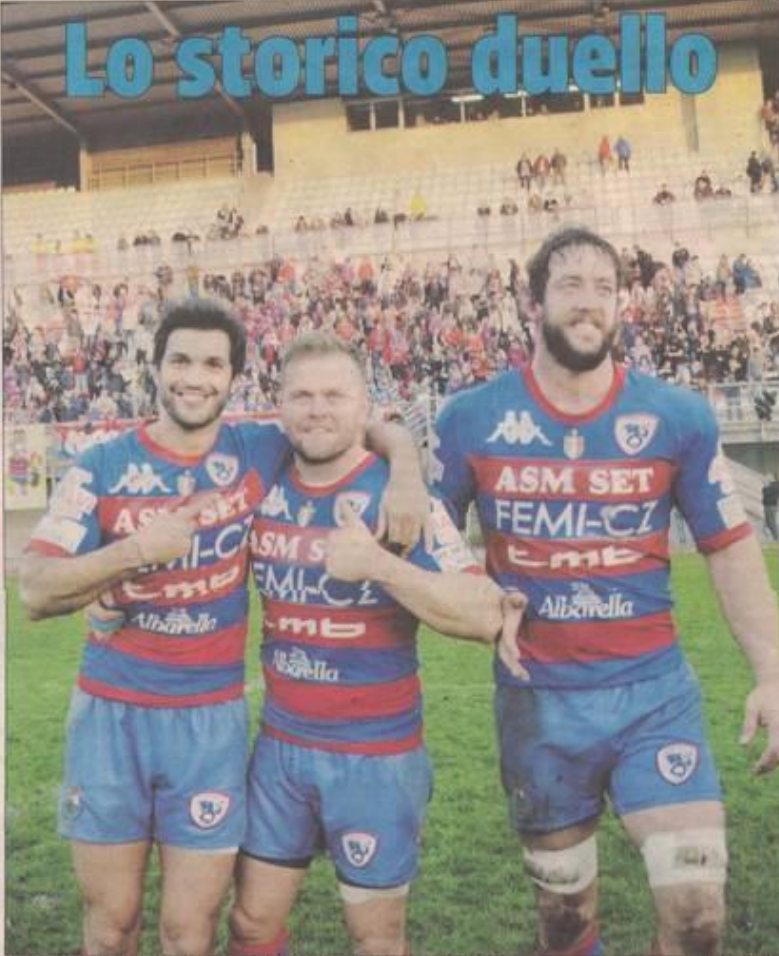
E' il giorno del derby al "Battaglini", è il giorno dell'infinita sfida Feni Cz Rugby Rovigo Delta-Petrarca Padova Alle pagine VII-X

Il Delta Rovigo ritrova Sentinelli occhio al Mezzolara in casa è pericoloso A pagina II