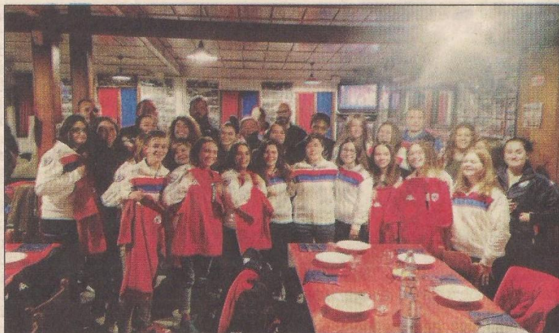
Alcuni momenti della serata a tinte rossoblù che si è svolta mercoledì

Il team Ladies Rugby Rovigo Delta farà la sua prima uscita in occasione del match tra Femi Cz e Patarò Calvisano di domenica 19 novembre, mettendo in scena una breve dimostrazione sul campo principale del "Battaglioni" tra primo e secondo tempo della partita di Eccellenza.